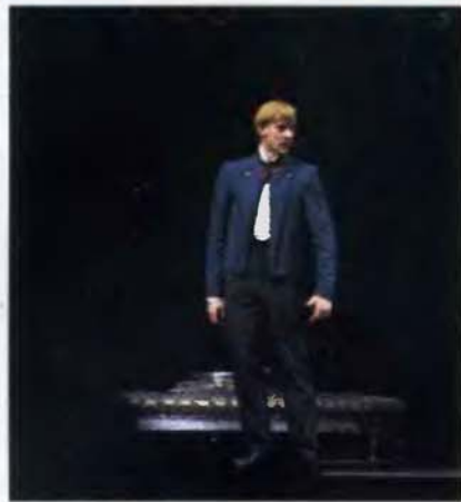
Сцены из спектакля «Мудрец».