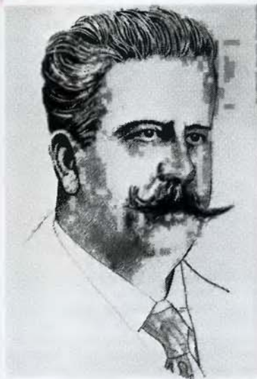
На снимках вы видите прижизненный графический портрет Руджеро Леонкавалло, а также фотографии певцов Энрико Карузо и Пласидо Доминго.